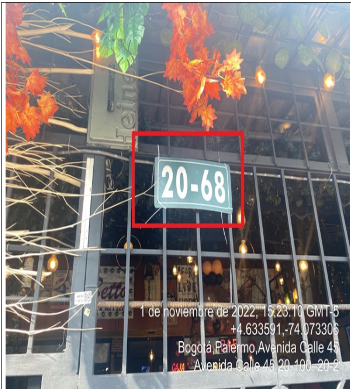
En la cual se evidencia la nomenclatura urbana donde se ubica el establecimiento comercial BETTO PARRILLA CAFE BAR , en la CL 45 No. 20 – 68 de la localidad de Teusaquillo.