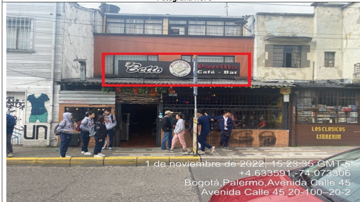
En la cual se evidencia un (1) elemento tipo aviso en fachada perteneciente al establecimiento comercial BETTO PARRILLA CAFE BAR , el cual se encuentra volado de la fachada del establecimiento comercial y al momento de la visita se encontraba instalado sin el registro ante la SDA.